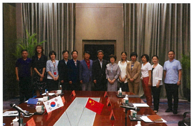
실무회의 후 기념사진