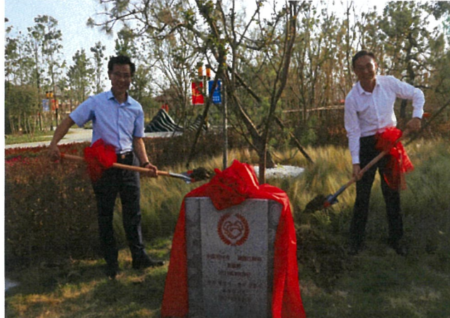
자매결연 15주년 기념식 후 식수