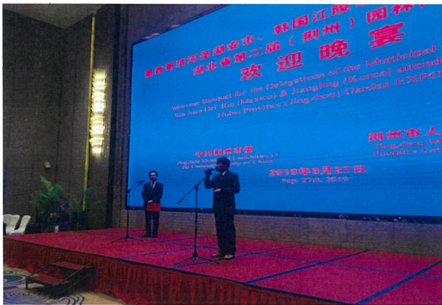
부당서기 주재 환영오찬