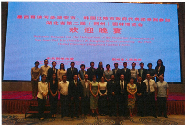
부당서기 주재 환영오찬 후 기념사진