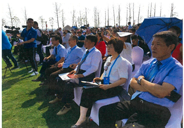
원림박람회 개막식 참석