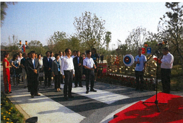
자매결연 15주년 기념식