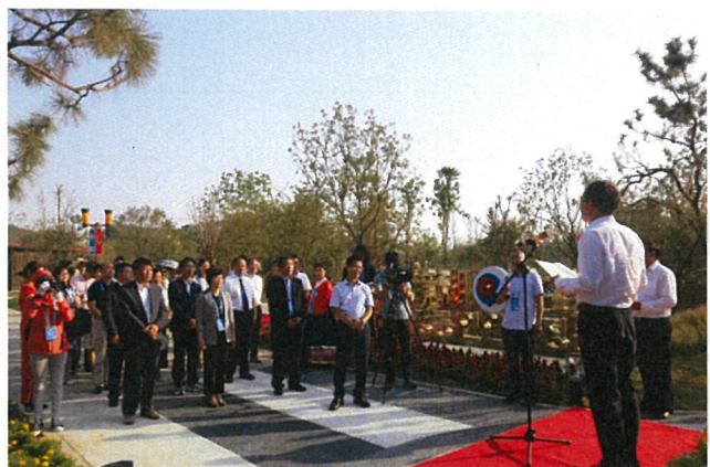
자매결연 15주년 기념식