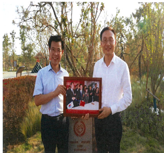
자매결연 15주년 기념식 기념품 전달