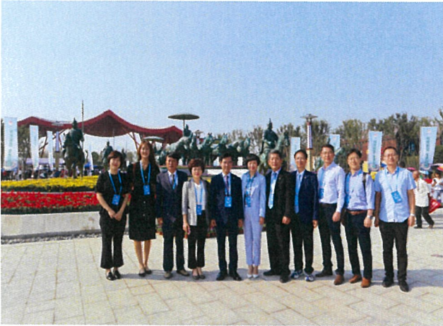
원림박람회 개막식 참석