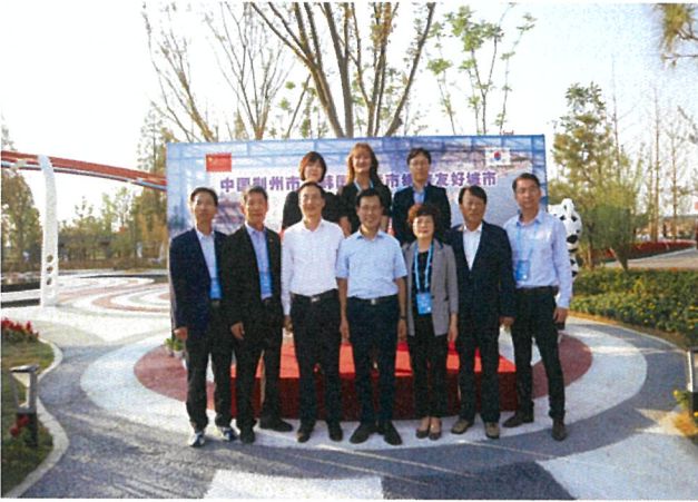
자매결연 15주년 기념식