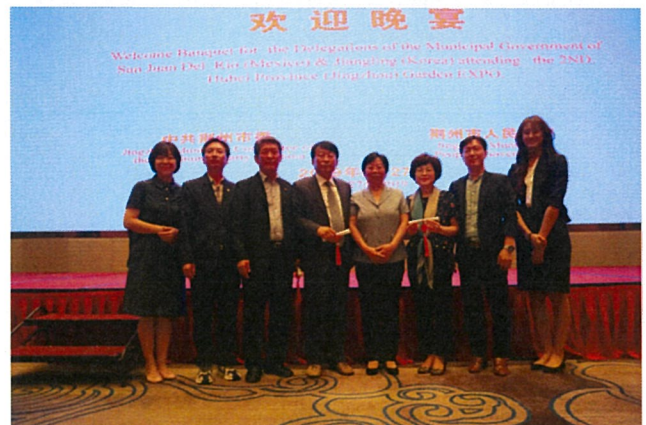
부당서기 주재 환영오찬 후 기념사진