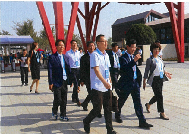
원림박람회 개막식 참석