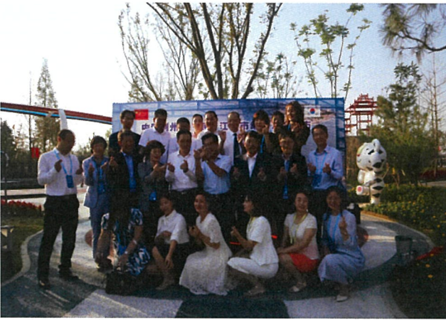
자매결연 15주년 기념식