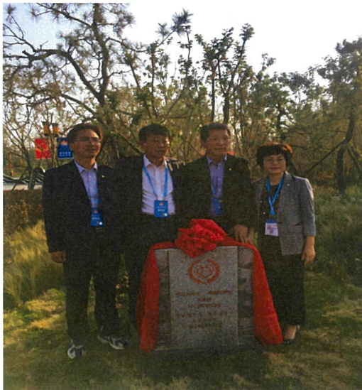
자매결연 15주년 기념식 후 식수