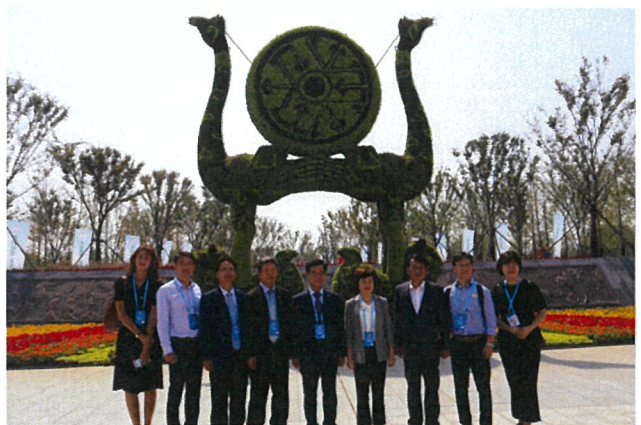
원림박람회 개막식 참석