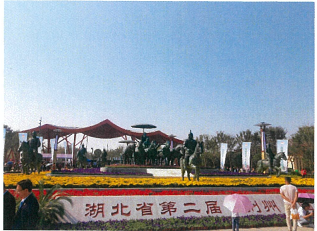
원림박람회 개막식 참석