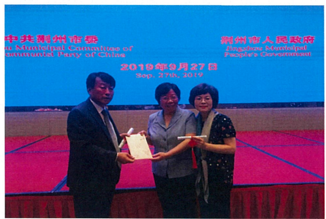
부당서기 주재 환영오찬